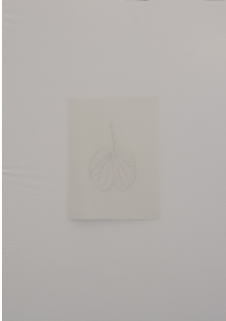
NHM-1 (2015). Instalación en pared. Dibujos y polietileno inflado. 25x29cm.