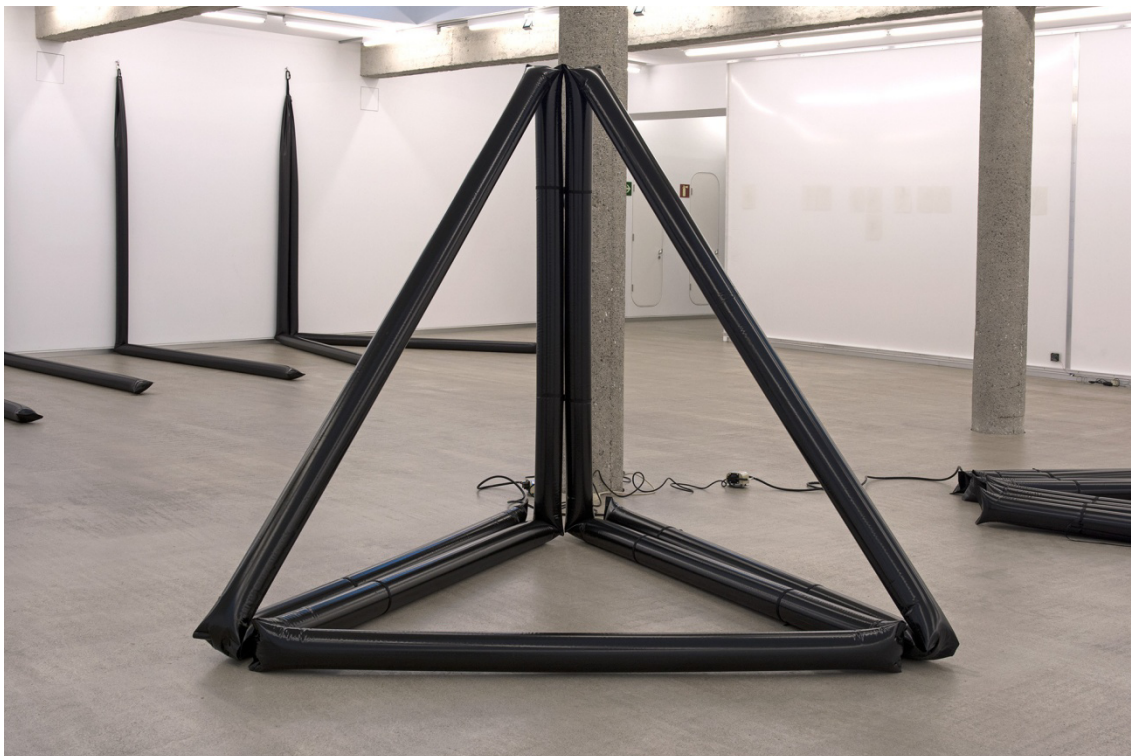
MDD , (2015). Escultura Lona inflada. Medidas variables (15 x 250 x 230 cm.)