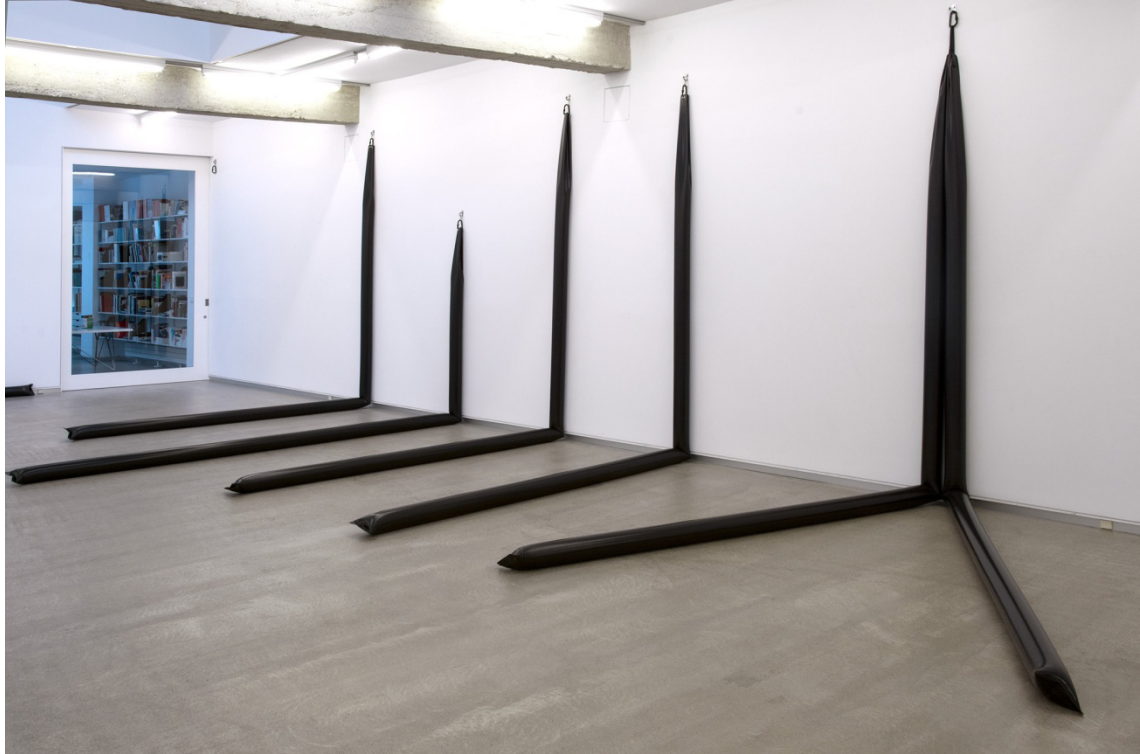
SM-Totem (2015) Instalación compuesta de cinco elementos Lona y agua. 330 x 750 x 400 cm