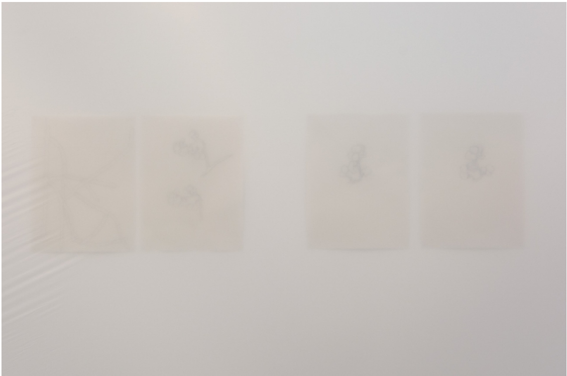
Detalle de la instalación