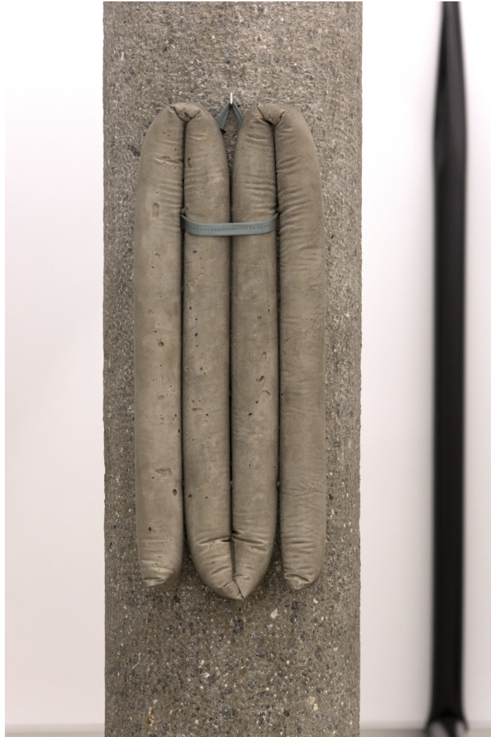
3333 (2015). Escultura, Hormigón. 70 x 30 x 8 cm.