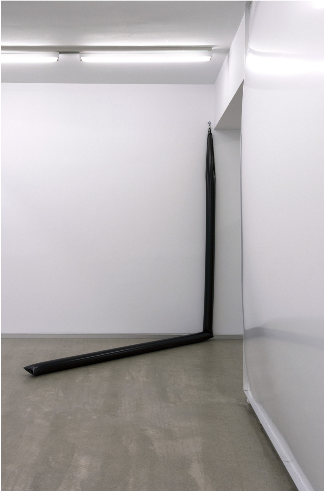
2+NO (2015). Instalación Lona y agua. Medidas variables. Tres elementos de 320 x 15 x 300 cm