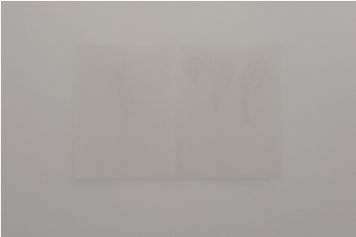
Detalle de la instalación