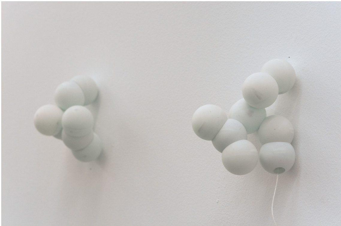
Motor Rank (2015). 67 esculturas articuladas plástico y aluminio