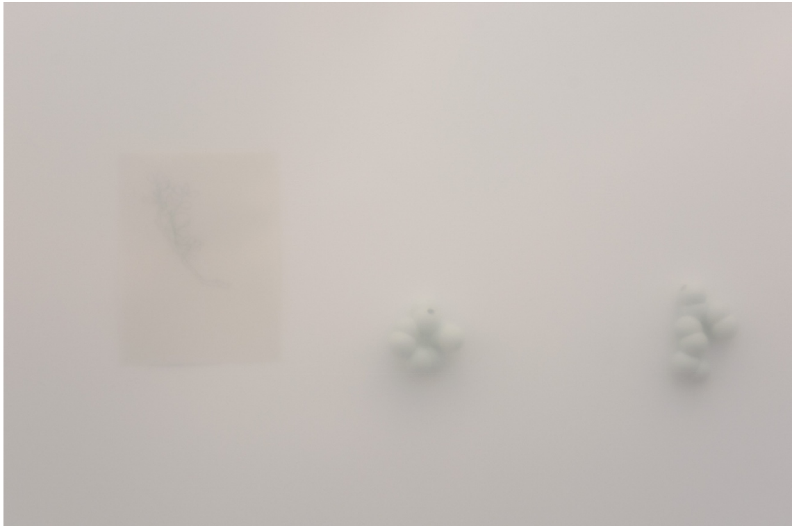
Detalle de la instalación