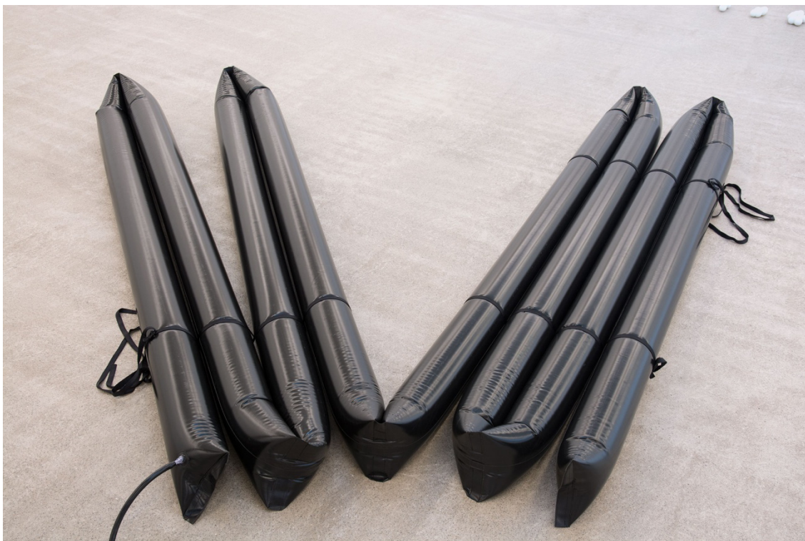
MM(2015). Escultura Lona inflada. Medidas variables (15 x 240 x 260 cm.)