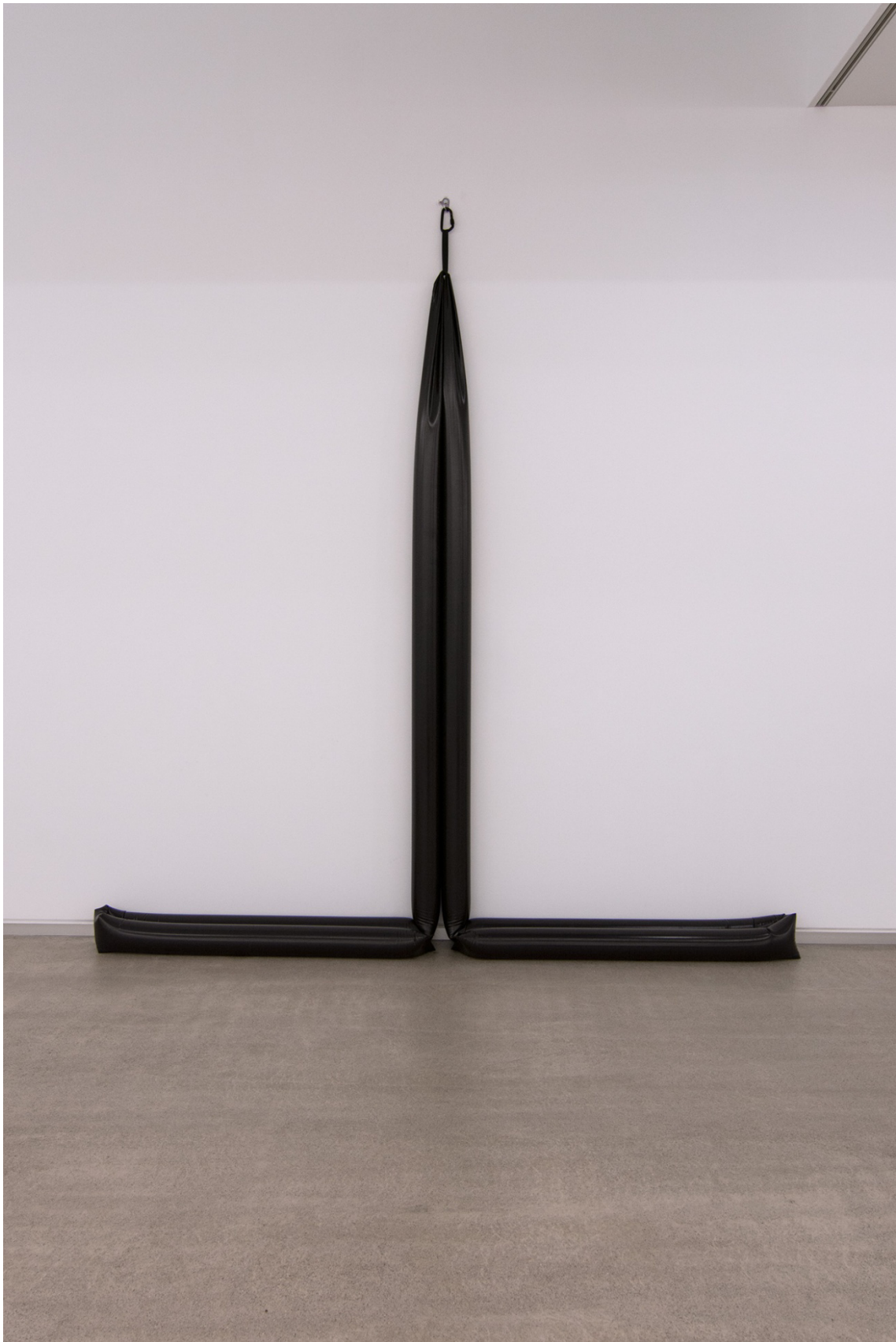
T-Plexo , (2015). Escultura Lona y agua. 330 x 300 x 15 cm.