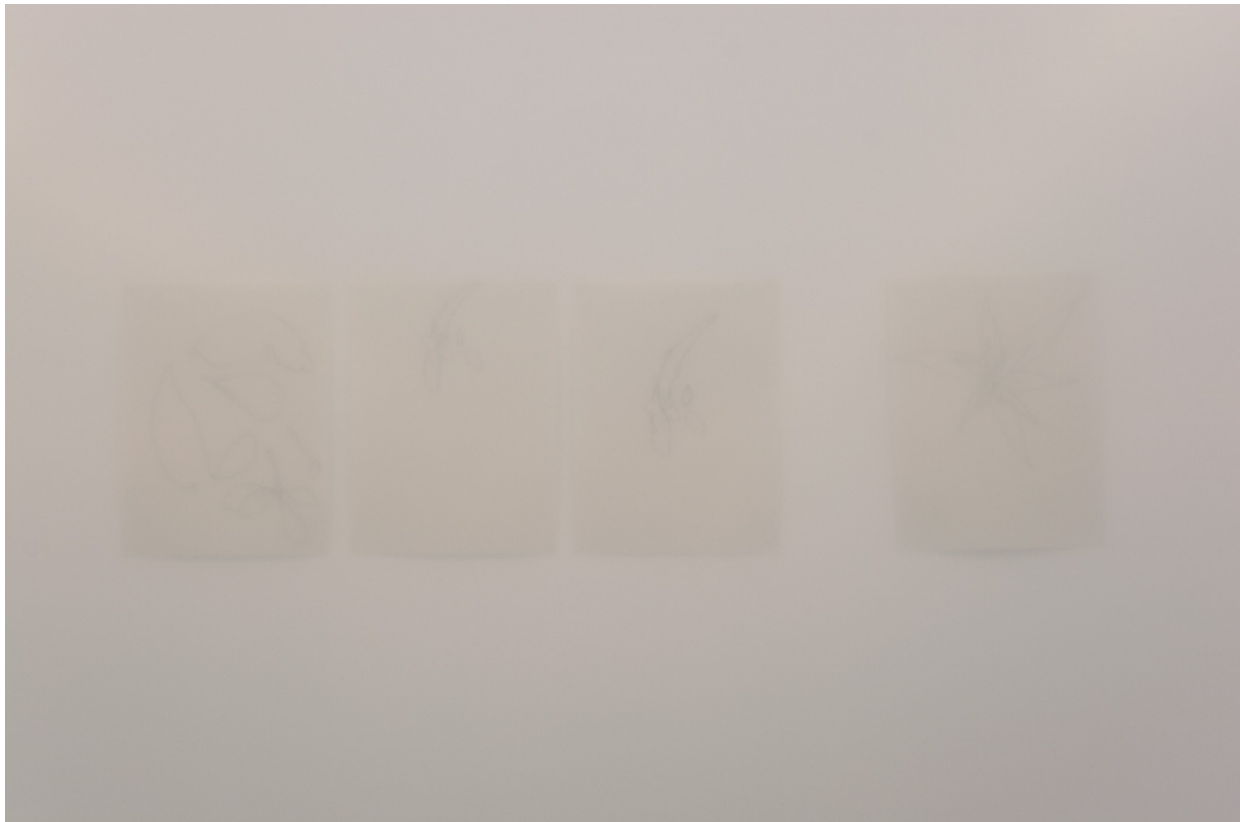
Detalle de la instalación