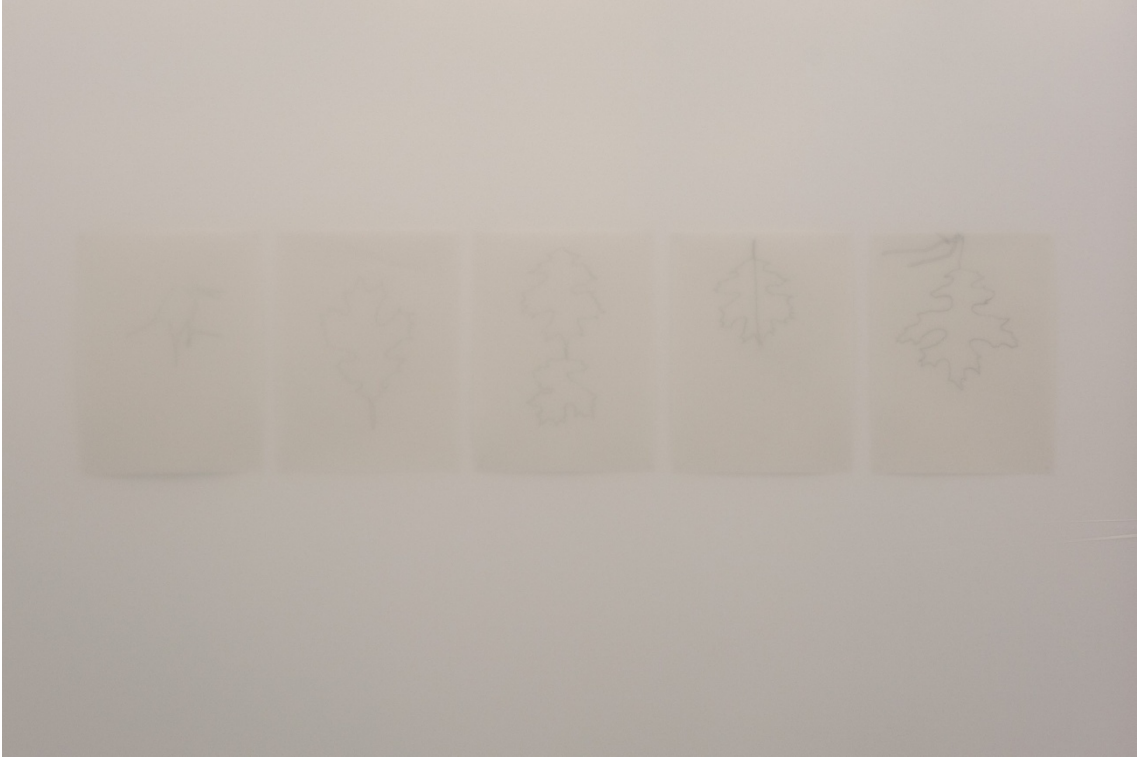
Detalle de la instalación