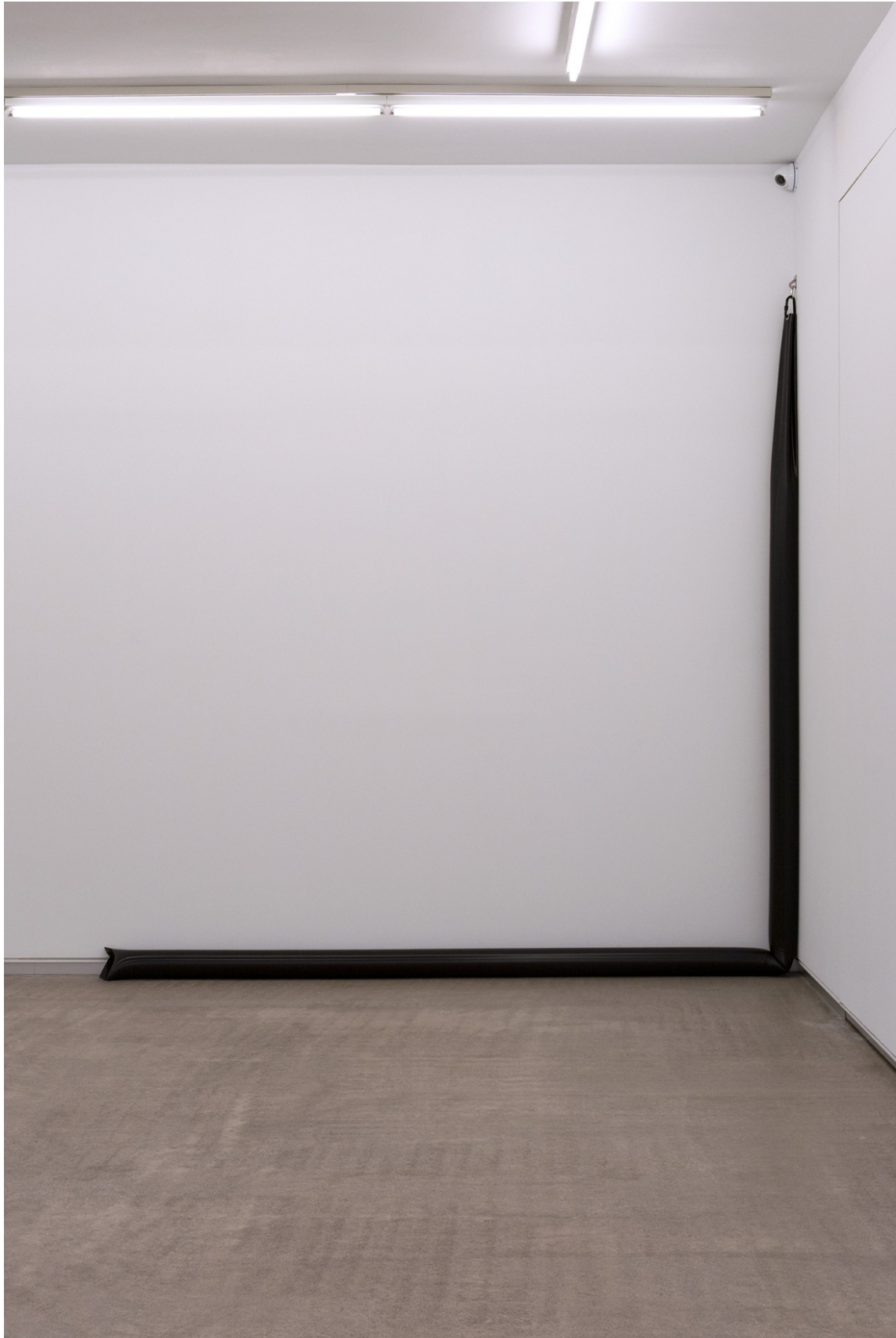
2+NO (2015). Instalación Lona y agua. Medidas variables. Tres elementos de 320 x 15 x 300 cm