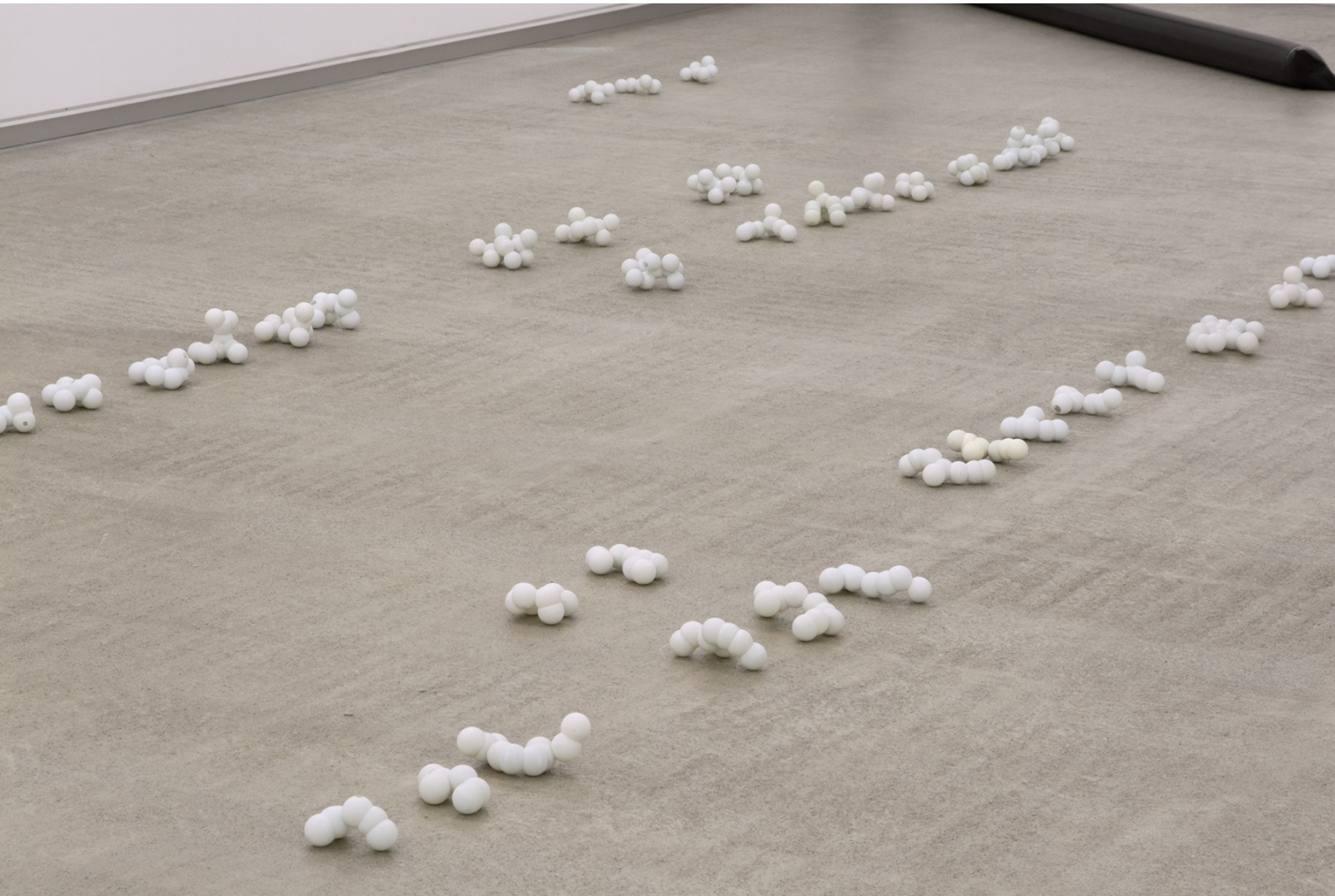
Motor Rank (2015). 67 esculturas articuladas plástico y aluminio