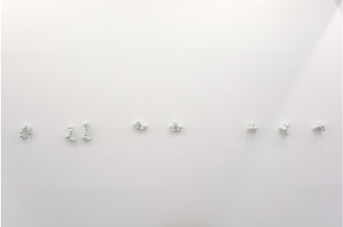
Motor Rank (2015). 67 esculturas articuladas plástico y aluminio