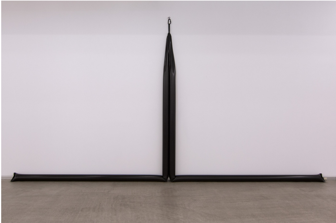
T-Skeol , (2015). Escultura Lona y agua. 330 x 600 x 15 cm.