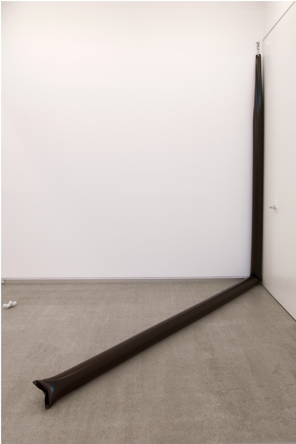
2+NO (2015). Instalación Lona y agua. Medidas variables. Tres elementos de 320 x 15 x 300 cm