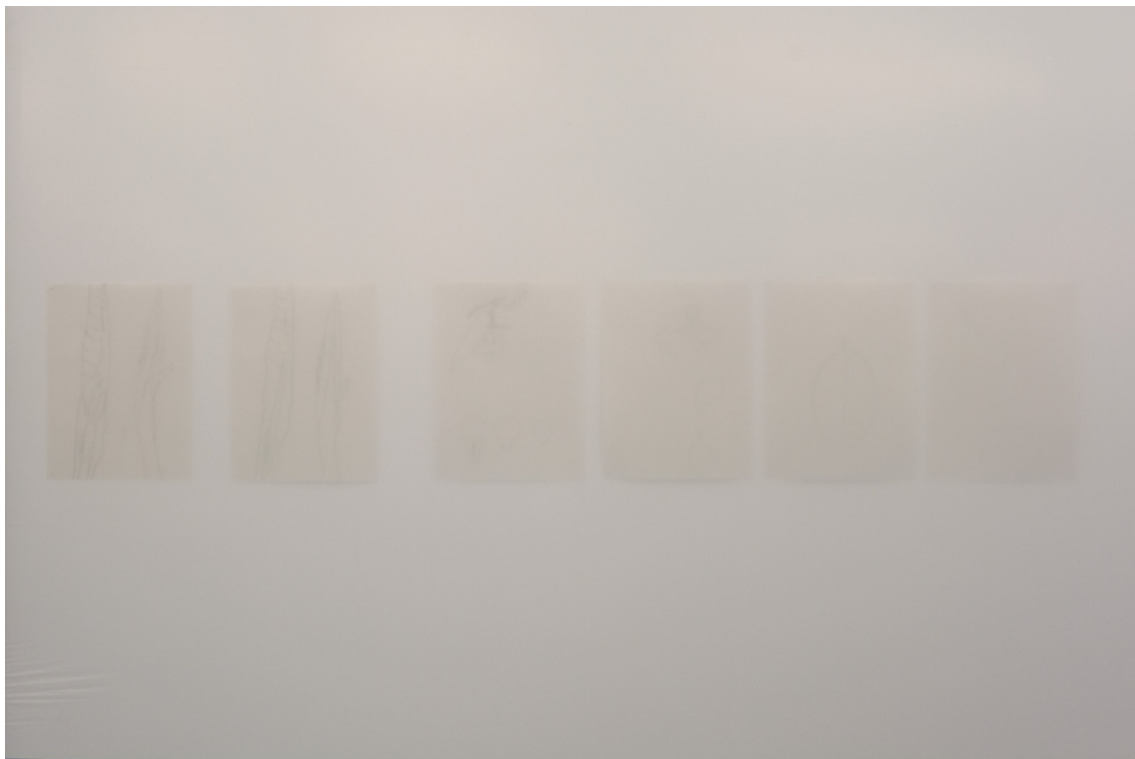
Detalles de la instalación