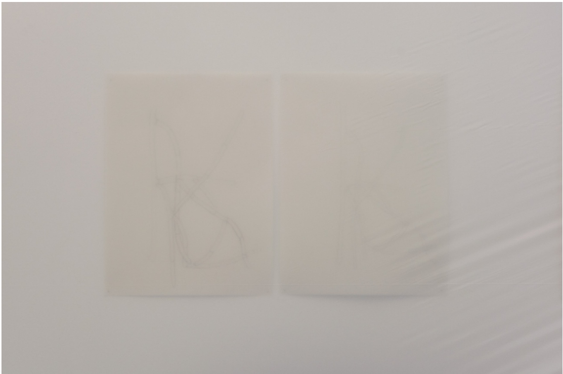
Dibujos y polietileno inflado. 355 x 500 cm.