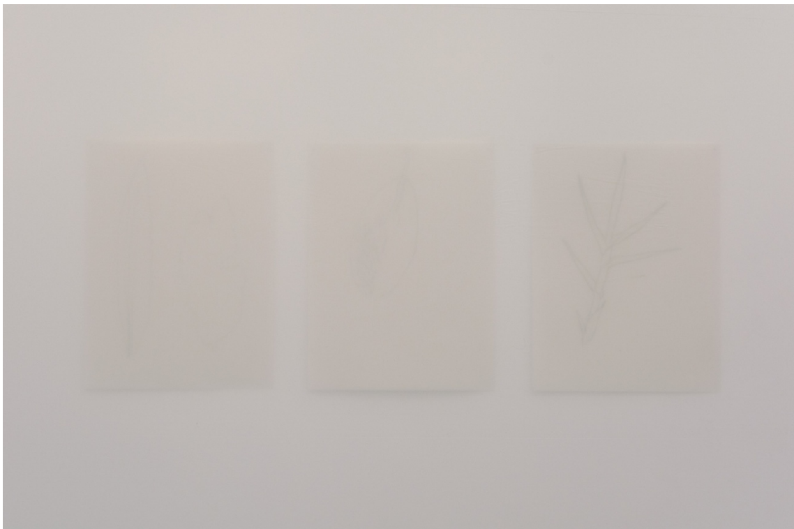
Detalles de la instalación